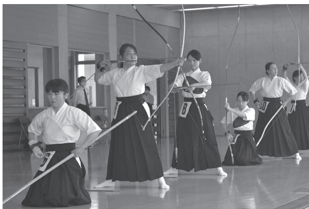
県民スポーツ大会 遠的、近的