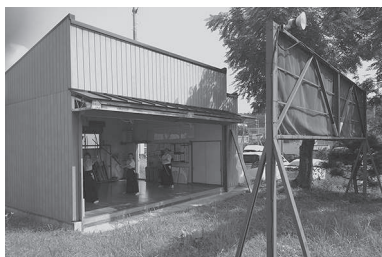
三人立での 稽古風景