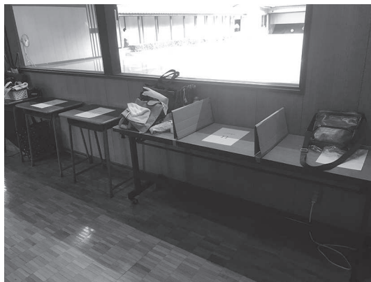
写真は熊弓会の手荷物置場

支部では、県連ガイドラインⅢと手引きを参考に、支部用の「射会の手引き」と「講習会の手引き」を作成しました。これらの手引きを遵守した形で、各道場で行事が始まりました。