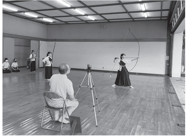
※大宮公園弓道場でビデオ審査会の風景