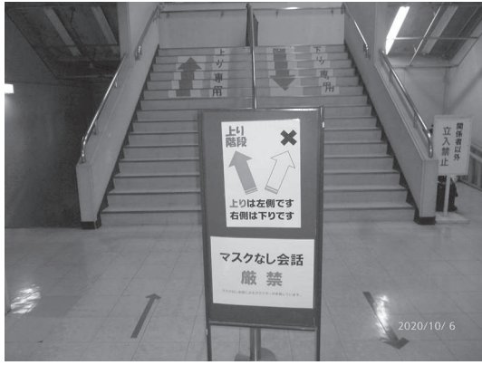
(体育館内の感染予防の様子)

現在、10月に開催予定のさいたま市民体育大会(高校生の部・一般の部)を通信制の大会として、所属道場等において、競技に細かい規制は設けずに練習の延長で、感染予防に十分気を配りながら行うことにしておりますが、これから年末から年始に向かって行われる予定の支部杯・市選手権大会や納会、初射会などは、感染の流行状況にもよりますが開催が危ぶまれます。特に今年度は支部・市弓連創立20周年に当たり記念行事を行うことにしていましたが、来年度への延期もやむを得ないのではないかと考えています。