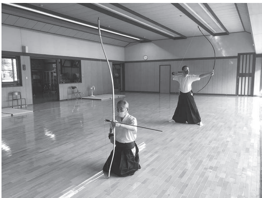
熊谷運動公園弓道場の練習風景

今後、冬場に向けた防寒対策と換気対策、そして参加者の自覚と参加人数が課題になると思います。