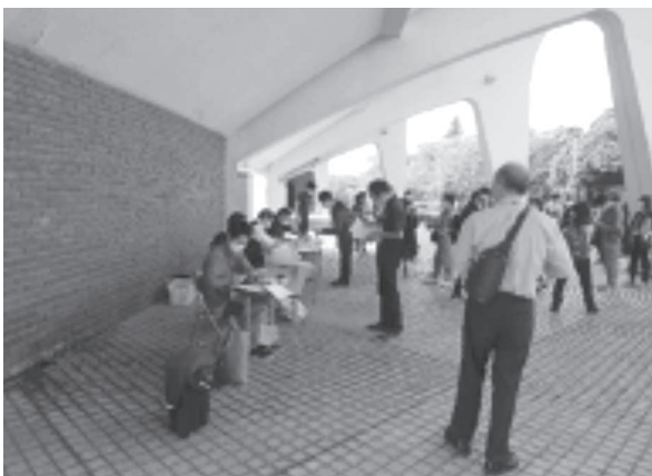
隣のプールも借りて運営 受付、次の選手待機