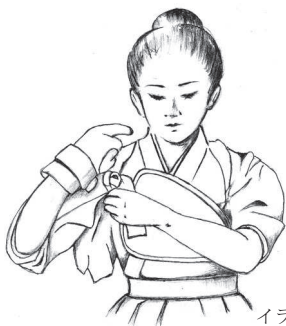
イラスト・松本 正