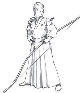
イラスト・松本 正