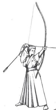
イラスト・松本 正

和光市弓道連盟では、流行初期段階から、ス ポーツドクターである副会長の人脈から入手し た感染症に関する情報のほか、マスク着用の推 奨や手洗い方法の留意点等を会員に説明して、 感染しない/感染させないことを基本行動とし 続けています。また、昨年度の弓道教室生が入 手困難な時期に手指消毒液を提供するなど、会 員各自が感染予防に貢献しています。道場閉鎖 の間に足の遠のいた会員が少しずつ通い始め ている現在、お互いが安心・安全に、楽しく稽古 ができるように配慮しつつ、この難しい状況を 会員全員で乗り越えて参ります。