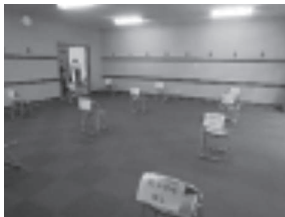
控えもディスタンス

初めての運営で、なかなか周知できない面もあり、各学校の顧問の先生や出場選手に迷惑をかけた点もあったかと思いますが、当初の目標は達成され、県大会を再開させることができたことは大きな成果でした。次回全国選抜県予選会に向けて、更に通常の大会に近づけるよう努力していきたいと思えます。