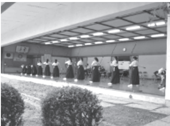
久しぶりの嬉しい大会風景 第1控えも入替制