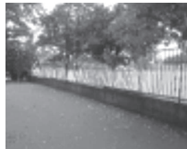
目隠しをして無観客