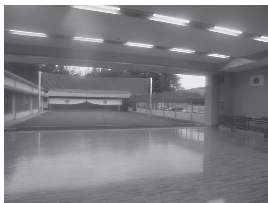
弓道場・射場から安土

また、小鹿野町は福祉やスポーツなどを推進し、健康で生き生きとした町づくりに取り組んでいます。この武道場については、三道はもちろんのこと、様々な利用なども可能として多くの町民の方々の利用促進を考えています。